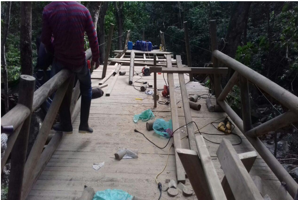
Fig 5 Construcción de puente en k1-803

CALLE 7 B No. 46-43, VILLAVICENCIO (META). TEL.: 321 358 8054