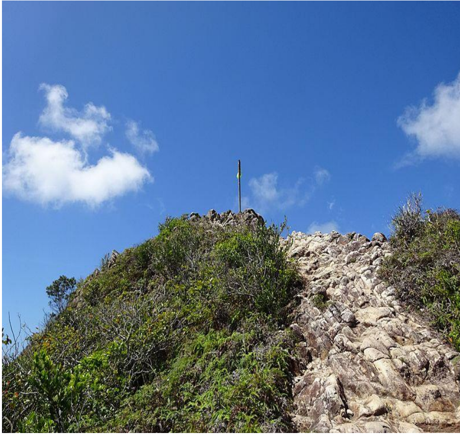
FIG 2 CERRO EL PICO SANTA CATALINA