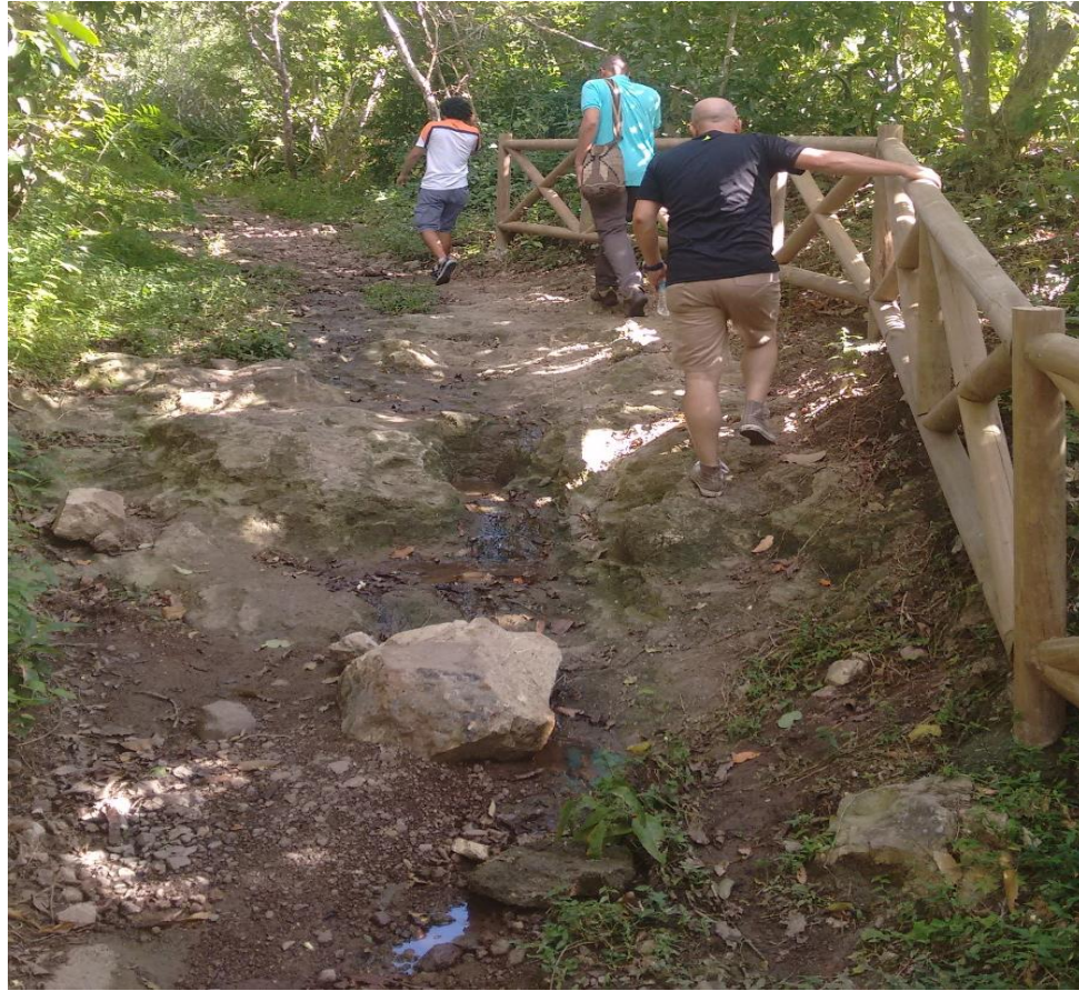
Fig 8 Visita representantes de FONTUR e Interventoría día 27 de enero.