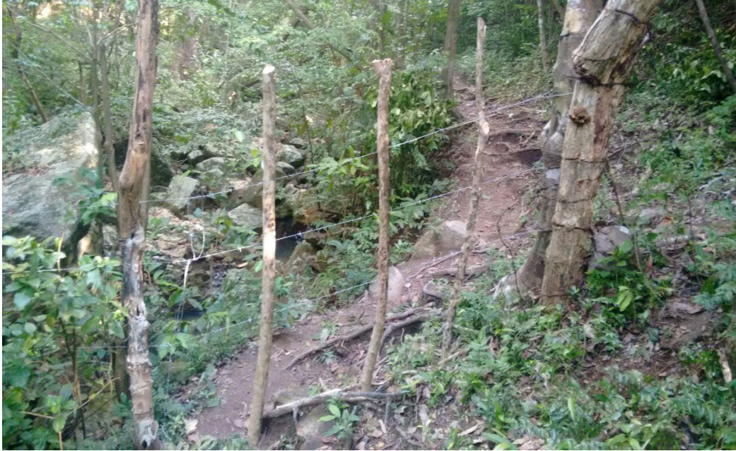
Fig 7 Cierre del paso arbitrario en k1-803