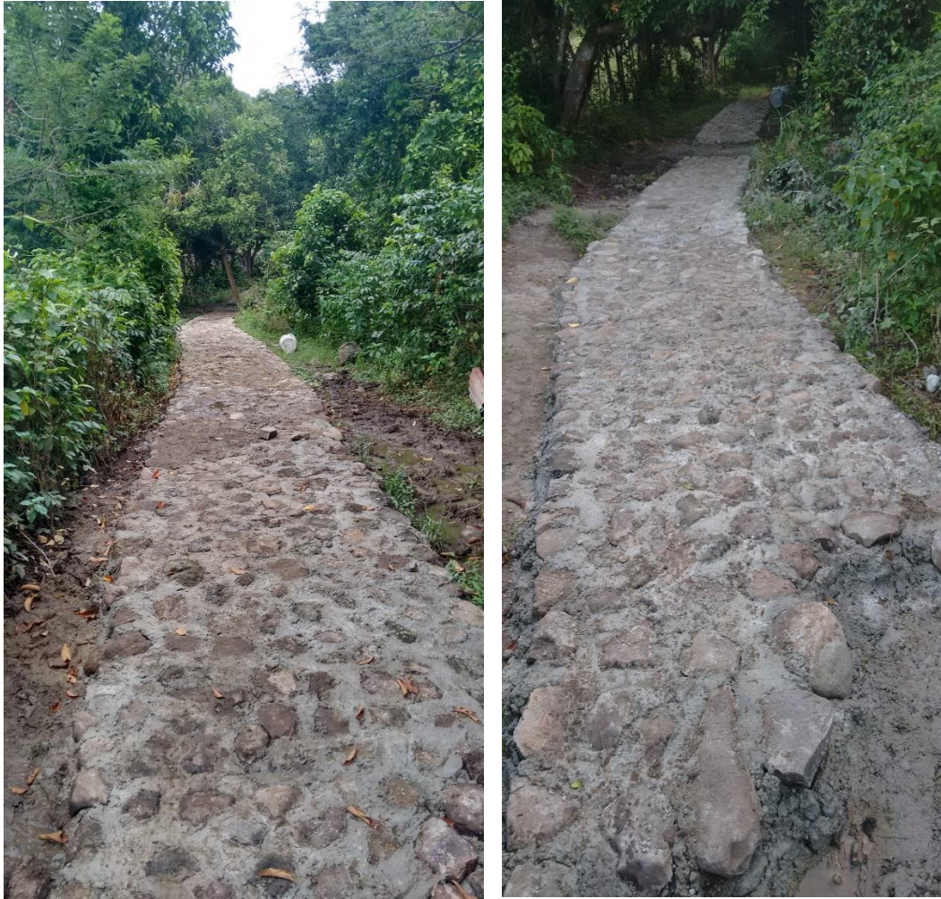
Fig 4 Enrocados de protección para sendero en k1-700