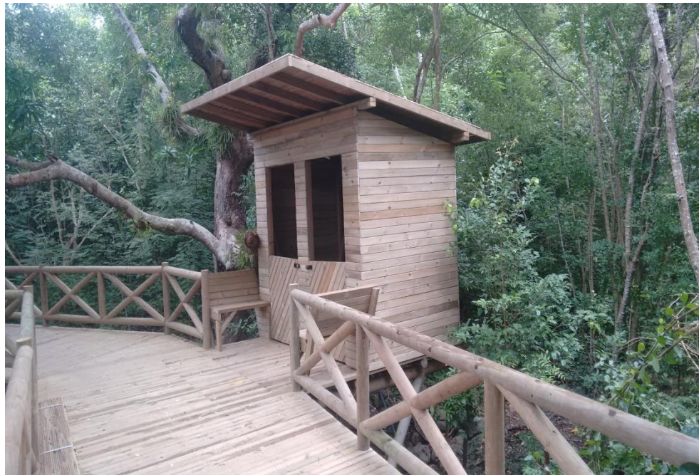
Fig 7 Forrado de caseta en k1-160 sobre puente

CALLE 7 B No. 46-43, VILLAVICENCIO (META). TEL.: 321 358 8054