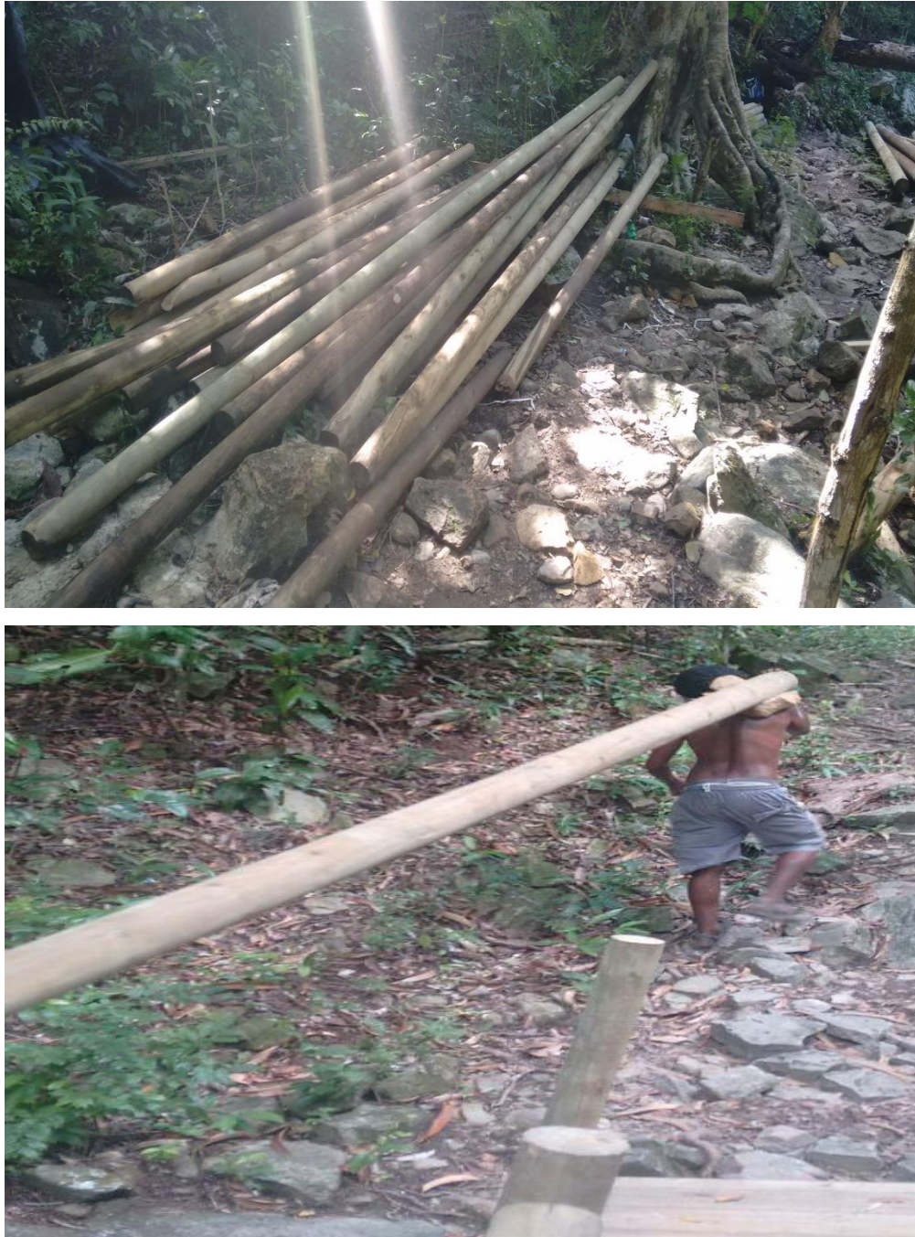
Fig. 3 Acarreo de madera hacia k1-803 y k2-020