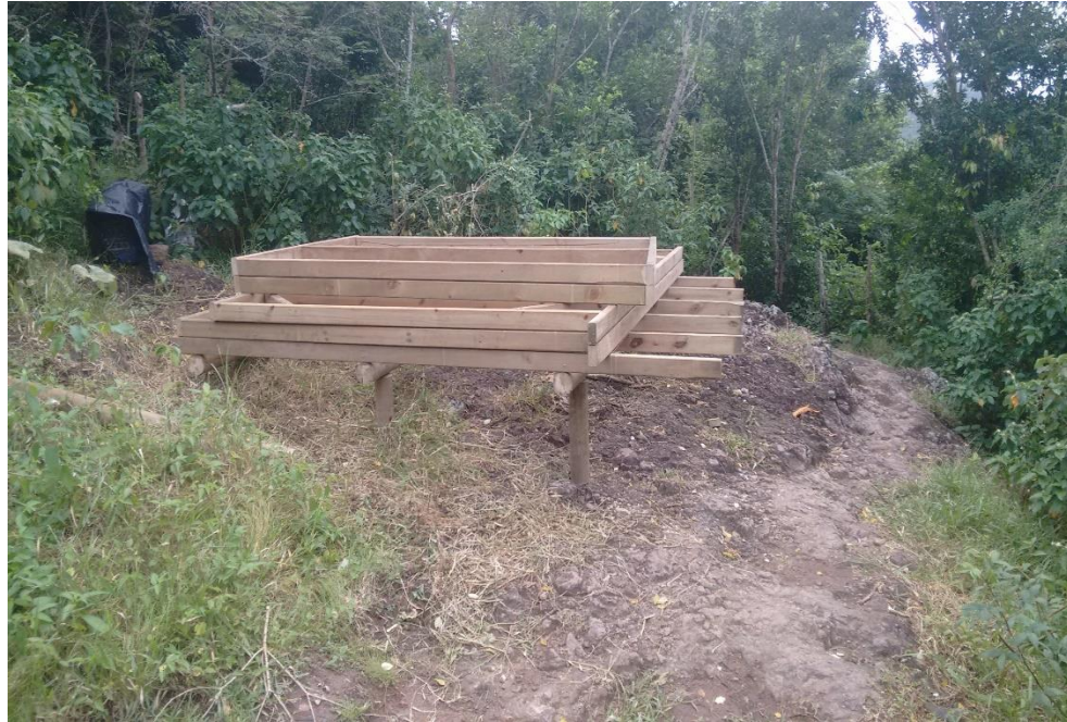
Fig 6 Construcción de caseta en k1-00